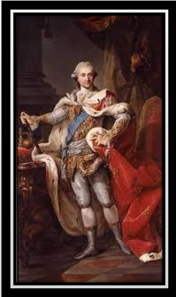
Król Stanisław August Poniatowski